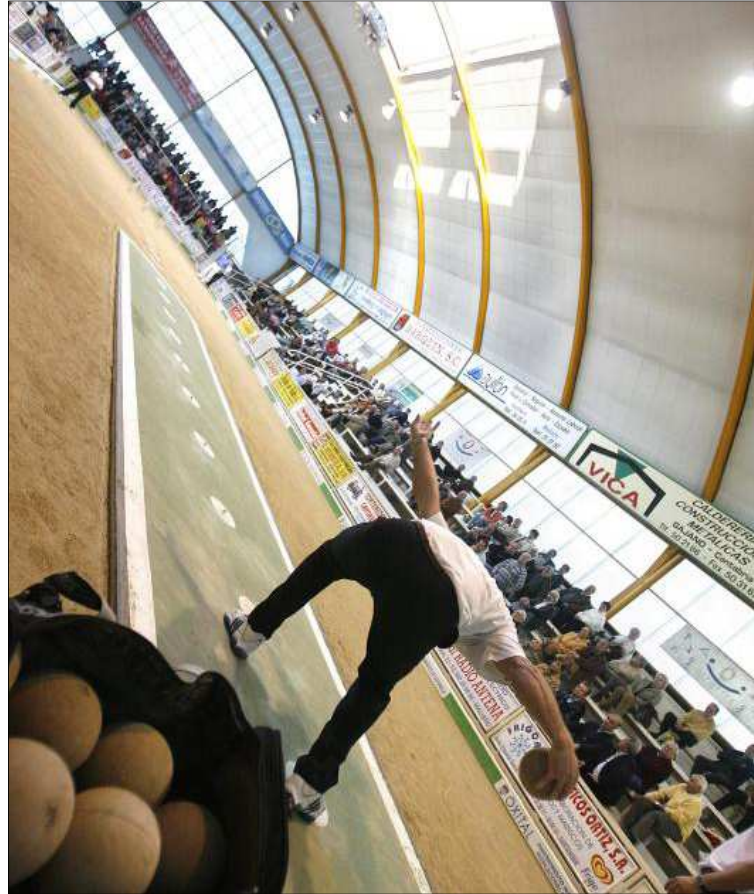
El bolo palma puede ver reformada su estructura.

Otro de los puntos que se intenta mejorar con este nuevo movimiento en el deporte vernáculo es avanzar en lo estrictamente